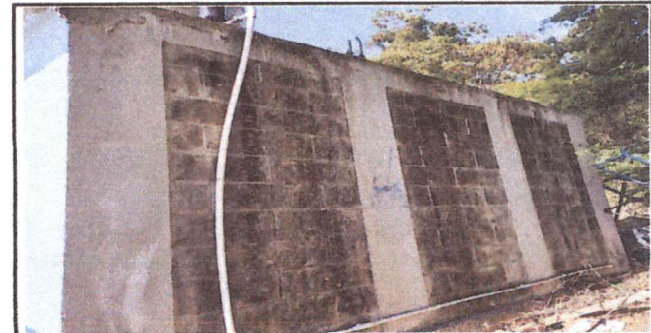
REPELLO DE PARED DE BAÑOS

Observación: Si es necesario se pueden agregar hojas adicionales y actualizar el número de hojas.