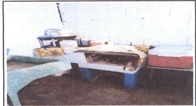
REPARACION DE COCINA