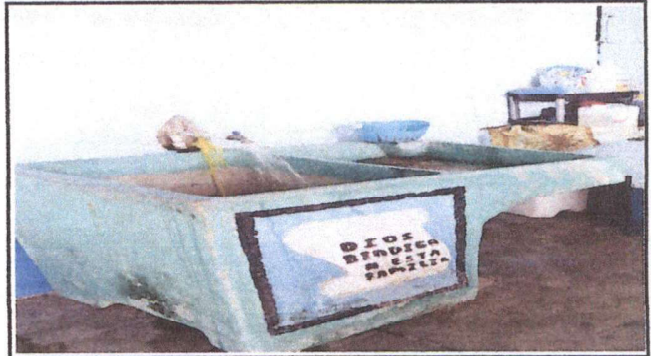
SUSTITUCION DE GRIFO