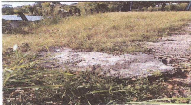
LOSA DE CEMENTO