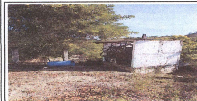
REPARACION DE BODEGA